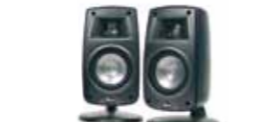
Synergy QUINTET Satellite

Pasma przenoszenia: 110 Hz-23 kHz Moc/moc max: 50 / 200 W Impedancja: 8 ohms Czułość: 90,5 dB Wymiary: 211 x 127 x 160 (mm) Waga: 1,6 kg