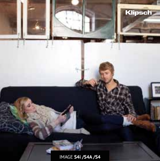
IMAGE S4i /S4A /S4