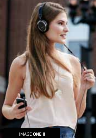
IMAGE ONE II