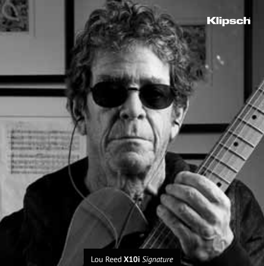
Lou Reed X10i Signature