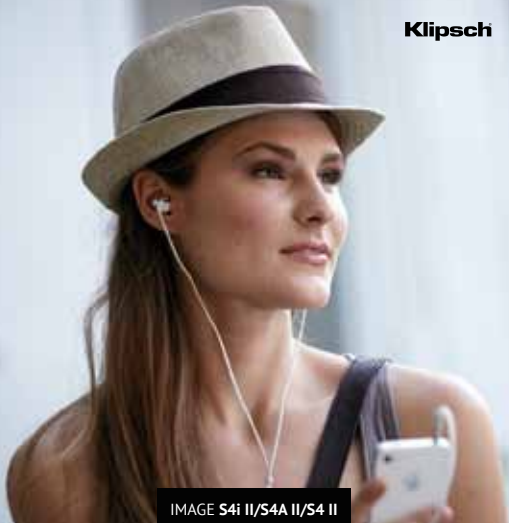
IMAGE S4i II/S4A II/S4 II