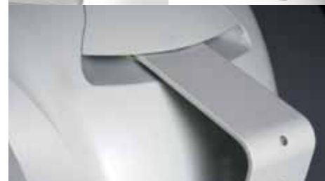
montowanie IPSO w zestawie