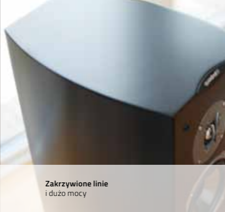
Zakrzywione linie i dużo mocy