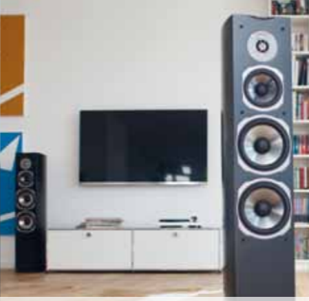
Nobliwe wykończenie Opcjonalnie w kolorze czarnym lub białym