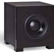
Głośnik niskotonowy QUBE 7