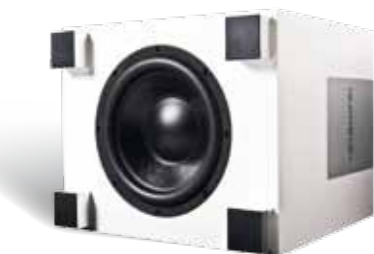
Głośnik niskotonowy QUBE 12

aktywny Subwoofer Bassreflex 70/100 W 33 Hz - 200 Hz 50 Hz - 150 Hz regulowana 250mV <0,5 W 0/180° 220 mm Ø 32,6 x 29,6 x 31,5 cm 230 ~ 8 kg Obudowa: Czarny Decor Biały Decor