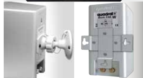
Opcjonalne uchwyty ściennie do MAXI 220W i 330W