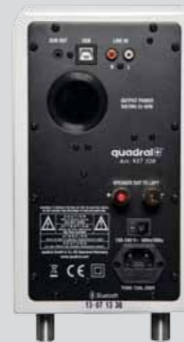
Tylni panel elektronika