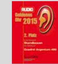
AUDIO Leserwahl 2015 ARGENTUM 490