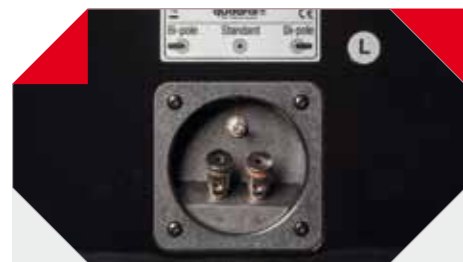
Terminale głośnikowe z zaciskami