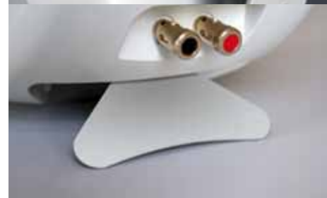
podstawka IPSO w zestawie

Zestaw 5.1-kanalowy nie może często zostać ustawiony optymalnie w wielu pomieszczeniach, a nawet w kinie domowym, ponieważ powinien on emitować dźwięk bezpośrednio do obszaru znajdującego się za nim. Aby w takich okolicznościach stworzyć prawdziwie dobre wrażenie przestrzenności bez konieczności bezpośredniego ustawiania jednego z głośników, idealnie jest zainstalować źródło dźwięku rozproszonego, takie jak PHASE 15 marki quadral, którego zamontowany z tyłu przełącznik umożliwia zastosowanie go jako głośnika bipolarnego, dipolarnego lub nawet całkiem normalnego. Ustawienie dipolarne powinno być zastosowane w małych pomieszczeniach, jako że dwa głośniki wysokotonowe działają w przeciwnych fazach i proces ten zapewnia tworzenie rozproszonego układu akustycznego. Oba głośniki wysokotonowe działają w tej samej fazie w trybie bipolarnym. Natomiast w ustawieniu „normal” PHASE 15 działa jako bezpośredni emiter dźwięku stosujący tylko jeden głośnik wysokotonowy.