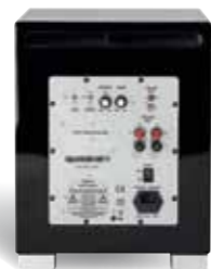
Panel tylny QUBE 8