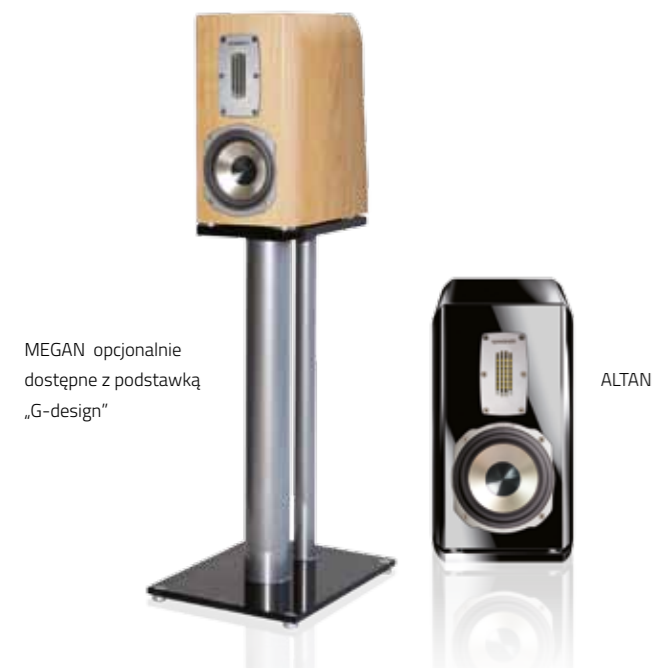
MEGAN opcjonalnie dostępna z podstawką „G-design”