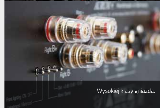
Wysokiej klasy gniazda.